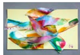
No.15「風の流れのコラージュ」