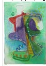
No.13 「アナログ フロッタージュ」

また、狭いスペースでも制作しやすいように、最大でもB4サイズ以内の画面であることがあげられます。研修会では、3つのプログラムのうち1つのプログラムの参考作品を制作して、他2つのプログラム制作工程画像の入ったテキストをもとにポイント説明を行います。この機会に、ぜひご受講ください。