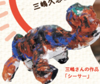
三嶋さんの作品 「シーソー」