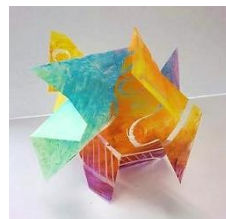
No.16「色彩と空間のコンポジション」

研修会では、3つのプログラムのうち1つのプログラムの参考作品を制作して、他2つのプログラム制作工程画像の入ったテキストをもとにポイント説明を行います。この機会に、ぜひ、ご受講ください。