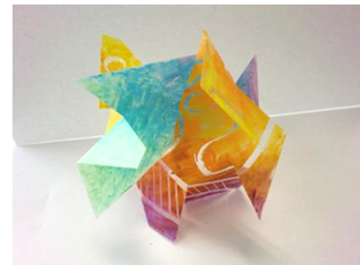
No.16「色面と空間のコンポジション」

使用画材をオイルパステルに絞り、シンプルな制作工程で素材感を大切に にしたプログラム研修会です。4歳以上の小さな子どもも取り組みやすく、 筆圧に問題のない認知症の高齢者にも適しています。